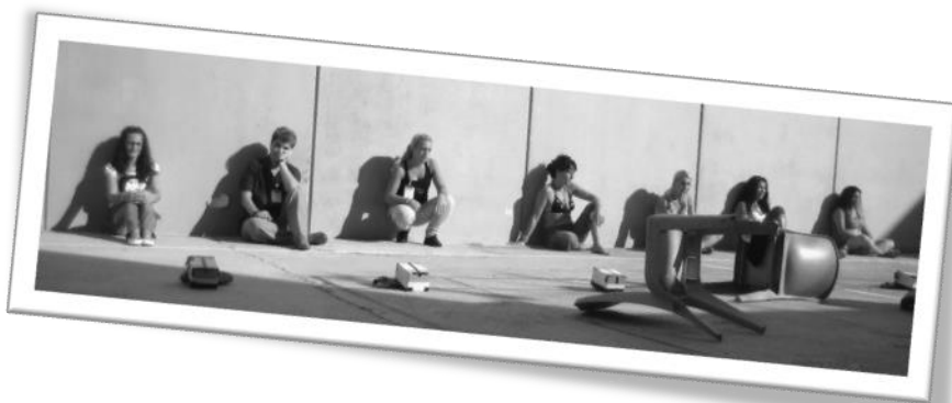
Fotografía producto de un curso dentro del centro penitenciario de Picassent, realizada con cámara estenopeica.