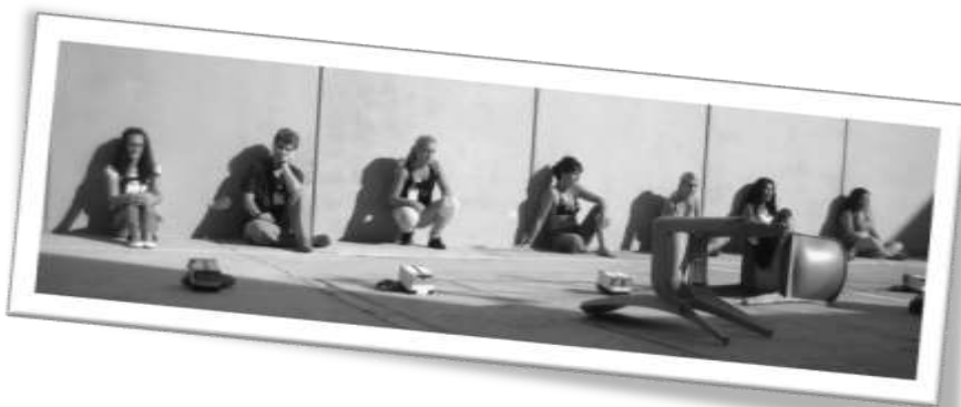
Fotografía producto de un curso dentro del centro penitenciario de Picassent, realizada con cámara estenopeica.